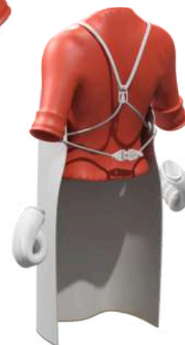
Sistema de correas y cierre patentado para facilitar la colocación y ajuste