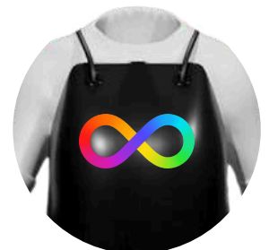
Personalización Impresión UVI calidad premium