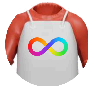
Personalización Impresión UVI calidad premium