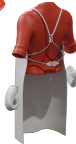
Sistema de correas y cierre patentado para facilitar la colocación y ajuste