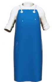
Otro color disponible: Azul.