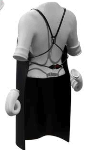
Sistema de correas y cierre patentado para facilitar la colocación y ajuste