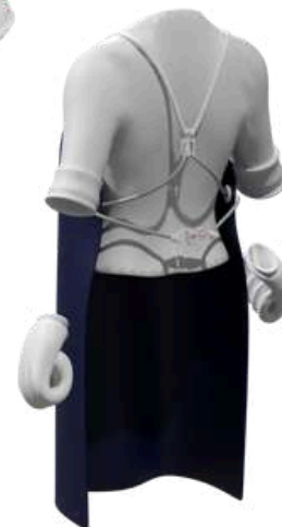
Sistema de correas y cierre patentado para facilitar la colocación y ajuste