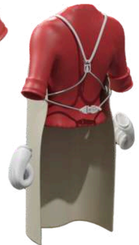
Sistema de correas y cierre patentado para facilitar la colocación y ajuste