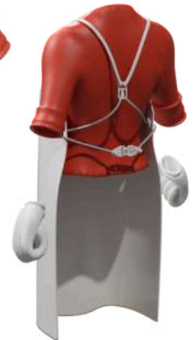
Sistema de correas y cierre patentado para facilitar la colocación y ajuste