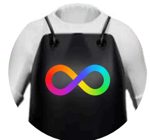
Personalización Impresión UVI calidad premium